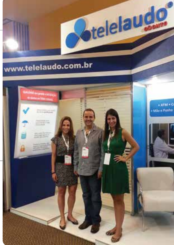
Telelaudo Odonto marca presença no evento Conabro 2013

“A tecnologia permite que clínicas e especialistas em radiologia odontológica aumentem a sua capacidade de atendimento e consequentemente a qualidade, uma vez que disponibilizamos o resultado em 24 horas”, complementa.