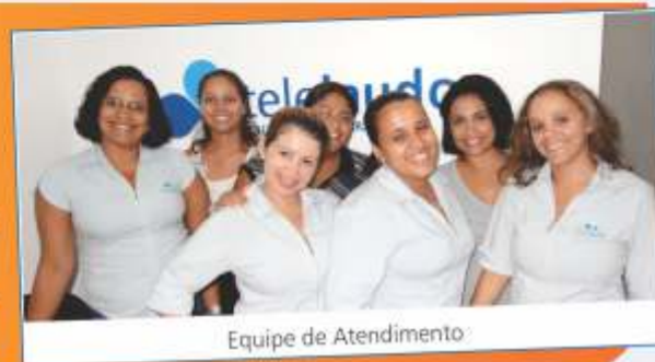
Equipe de Atendimento

Muito mais do que a tecnologia, o sucesso da Telelaudo está no empenho e dedicação das pessoas que trabalham aqui. Radiologistas, profissionais do administrativo, da TI e do atendimento entendem que fazem parte de uma engrenagem que só funciona bem se cada um fizer bem a sua parte. Desta forma, o processo flui da melhor maneira possível e isso se reflete na satisfação de todos os envolvidos.